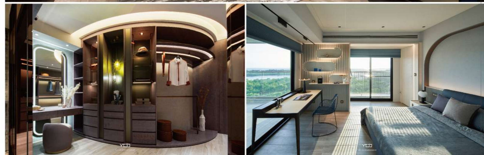
上圖——主臥室的天花造型，營造出蜿蜒天際的極光奇景，透過間接光氣的映照，將柔美光量向上蔓延。左下圖——主臥更衣室。右下圖——男孩房前方則是採光最好的大露台，透過大面窗景來連結露台空間，讓燦爛陽光引入室內，呈現敞闊舒心的休憩氛圍。