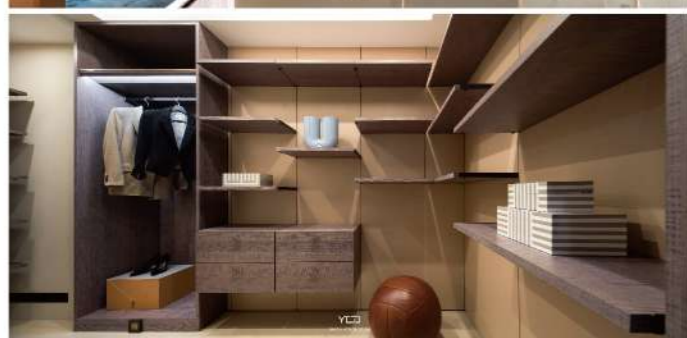
上圖——餐廳區透過鍍鈦金屬鋪展，與窗外美景相映，構築了虛實交錯的環繞式氛圍，讓用餐時也能與窗外美景相伴、沉靜在生活裡的每個片刻時光。左下圖——玄關右側衣帽間。右下圖——主浴空間以大幅落地窗景將天然海色圍塑成一幅絕美畫作。