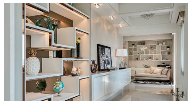
旅行帶回的收藏——陳列，就像一條美不勝收的藝術廊道