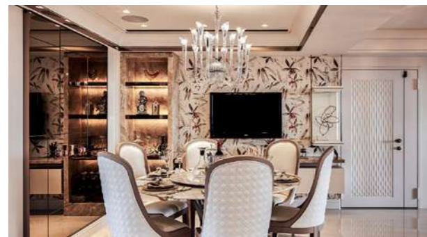
進門處的空間改造為餐廳，線條簡潔的吊燈、餐椅和藝術品，流露出古典優雅的氛圍。